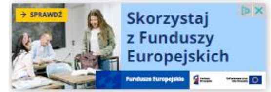
reklama w internecie