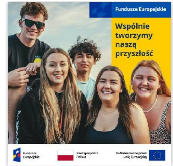
post w mediach społecznościowych