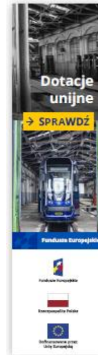
reklama w internecie